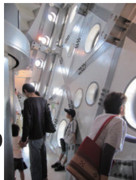
展望室内部の様子