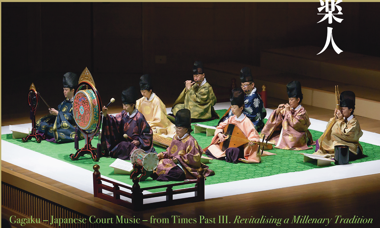
Gagaku – Japanese Court Music – from Times Past III. Revitalising a Millenary Tradition