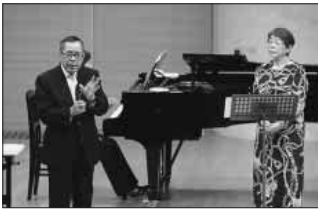
前回の「日本のうた」セミナーより