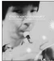
栗コーダーカルテット