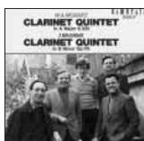
ライスター&ウィーンSQ盤。このジャケットはオリジナル盤のもので、ブラームスのクラリネット五重奏曲との組み合わせ。

これも、ライスターのCDが入手しやすいでしょう(カメラータ・トウキョウ CMCD15062)。ライスターは、そのほかクラリネットのためにモーツァルトが残した小品、断章、編曲作品を集