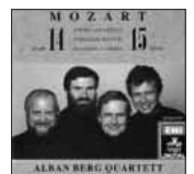
アルバン・ベルクSQ盤。

古今東西の名盤は山ほどある曲ですが、まずは「定盤」としてアルバン・ベルク四重奏団のもの(EMI TOCE13027)。オリジナル楽器によるクイケン四重奏団のものも、また違った魅力があります(デンオン/アリアレー COCO78086)。