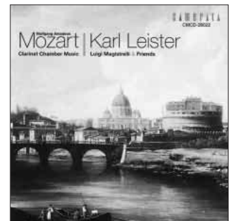
ライスターがモーツァルトのクラリネットのための断片や編曲作品を集めた貴重な盤。(カメラタトウキョウ CMCD28022)

さて、これらの断片は概して10小節とか20小節とか、すこし書かれたところで終わっているものが多く、それ自体はどうにもならないのだが、たとえばソナタ形式の展開部まで書かれていたりすれば、残りを他者が書き加えて「復元」することは不可能ではないし、そうしたくなるのがモーツァルトを愛する学者の人情というものだろう。前述のクラリネット五重奏曲楽章はその一例だが、これは「実は完成されていた」とする説もある(ATMアンサンブル第21回演奏会の紹介記事参照)。ほかに、ヴァイオリンとヴィオラのための協奏交響曲イ長調K Anh 104(320e)とか、数多くの舞曲とかの例があるし、ジグシュピール ツァイデ のよじりかなりの部分が完成していて、序曲などを他作品から借用して上演するものもある。大ミサ曲 八短調K 427(417a)のように、「完成した部分だけでよし」とする作品もある。そしてこうした未完作品の頂点に、数知れないほど多くの補筆復元の試みがなされてきた、音楽史上最高の未完作品のひとつがある。そう言うまでもなく、「死」という究極の理由によって完成を永遠に阻まれたレクイエム 二短調 K 626 だ。