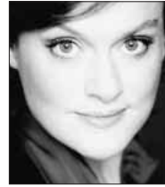
ヴェッセリーナ・カサロヴァ