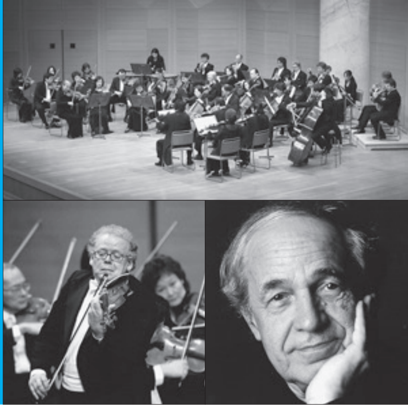
写真上;水戸室内管弦楽団(MCO):第65回定期演奏会より 下・左;ライナー・クスマウル&MCO:第56回定期演奏会より