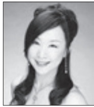
ルツェルン・フェスティバル・アカデミー(2005)より