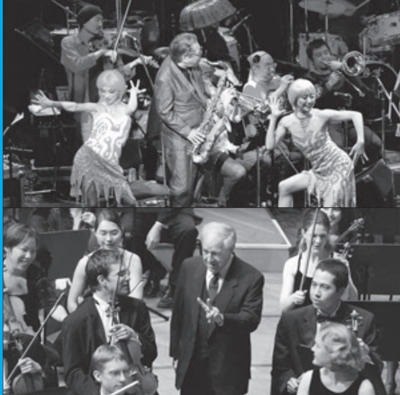
写真上;渋さ知らズオーケストラ