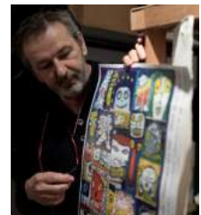
ダリオ・モレッティ