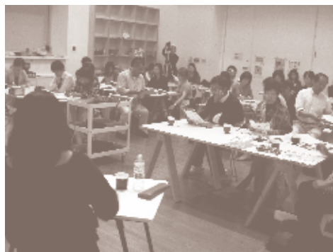
担当学芸員による企画展事前勉強会

【お知らせ】 コロナウイルス感染拡大防止を鑑みて、 応募締め切りを5月31日に延期します。 また研修の開始日も延期します。研修日は 決まり次第、応募者にお知らせいたします。