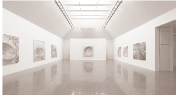
曾谷朝絵展「宙色」2013年 水戸芸術館現代美術ギャラリーでの展示風景

CACは現代美術センターの英語名称 (Contemporary Art Center) の略 ギャラリートーカーは水戸芸術館独自の用語です