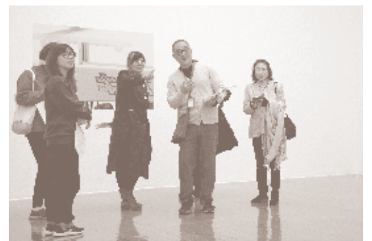
ウィークエンド・ギャラリートーク風景

【お知らせ】 コロナウイルス感染拡大防止を鑑みて、 応募締め切りを5月31日に延期します。 また研修の開始日も延期します。研修日は 決まり次第、応募者にお知らせいたします。