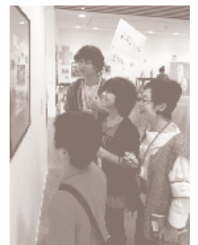
こどものためのギャラリートーク