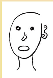
FUMIO TACHIBANA “書体” 2018