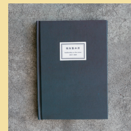
ハードカバー作品(参考)

※水戸黒は自然由来の染色方法であるため、 湿った状態では色移りするおそれがあります。