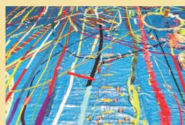
ワークショップ風景 (参考)