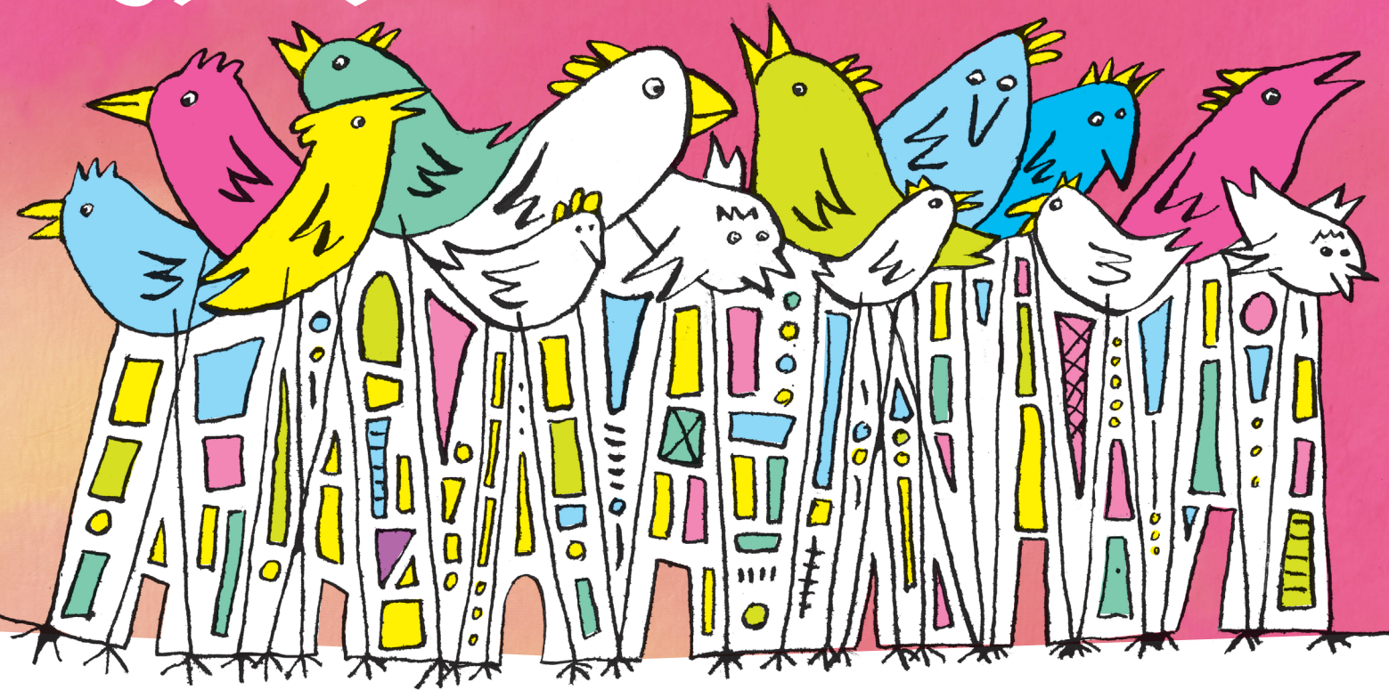
原画 "La città degli uccelli" (とりのまち) ©Dario Moretti

ここ水戸で 奏で、描き出される 子どもと大人のための ちよっぴりおかしくて幸せな あたらしい舞台作品