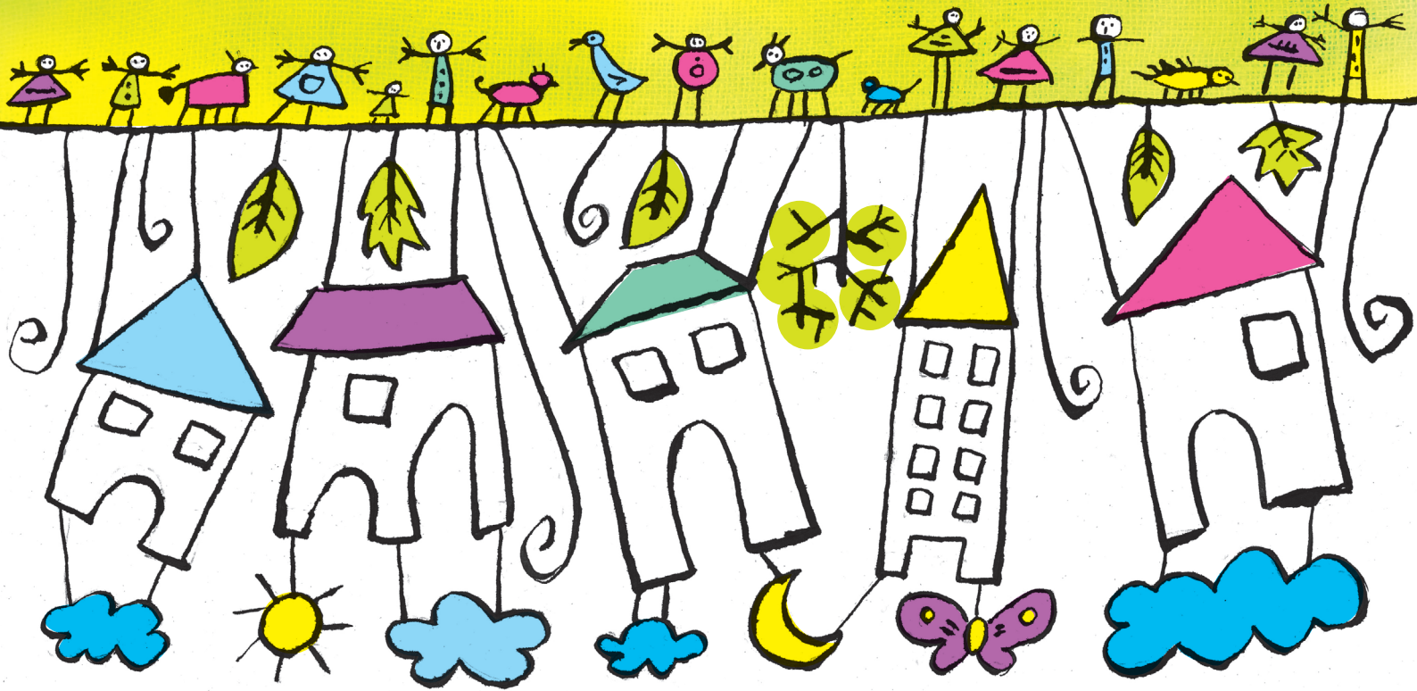
原画 "La città sospesa" (宙づりのまち) ©Dario Moretti

ここ水戸で 奏で、描き出される 子どもと大人のための ちよっぴりおかしくて幸せな あたらしい舞台作品