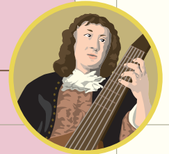
ディートリヒ・ブクステフーデ Dietrich Buxtehude (ca.1637-1707)