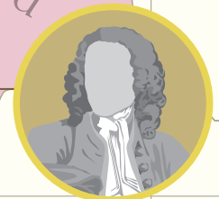
ニコラウス・ブルーンズ Nicolaus Bruhns* (1665-1697)