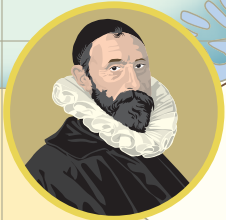
ヤン・ピーテルズゾーン・スヴェーリンク Jan Pieterszoon Sweelinck (1562-1621)