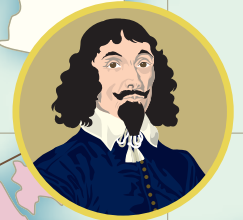
ハインリヒ・シャイデマン Heinrich Scheidemann (ca.1595-1663)