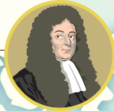
ヨハン・アダム・ラインケン Johann Adam Reincken (1623-1722)