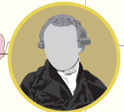
ゲオルク・ベーム Georg Böhm* (1661-1733)