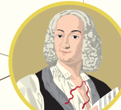
アントニオ・ヴィヴァルディ Antonio Vivaldi (1678-1741)