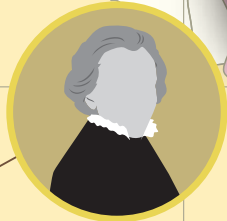
ニコラ・ド・グリニー Nicolas de Grigny* (1672-1703)