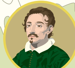
ジローラモ・フレスコバルディ Girolamo Frescobaldi (1583-1643)