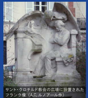
サント・クロチルド教会の広場に設置されたフランク像 (A.C. ルノアール作)