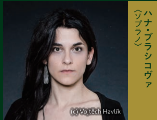
ハナ・ブラシコヴァ (ソプラノ)