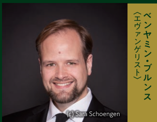
ベンヤミン・ブルンス (エヴァンゲリスト)