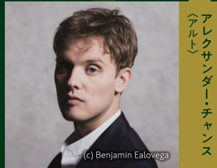
アレクサンダー・チャンス (アルト)