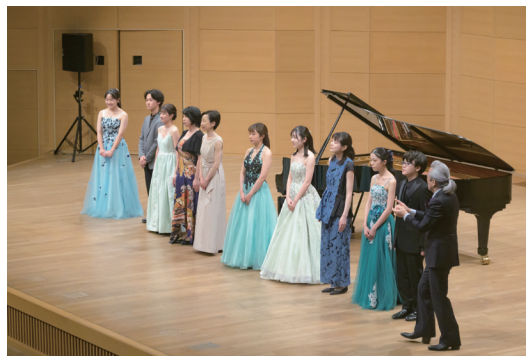
前回の演奏会より

【WEB】 https://www.arttowermito.or.jp/ticket/