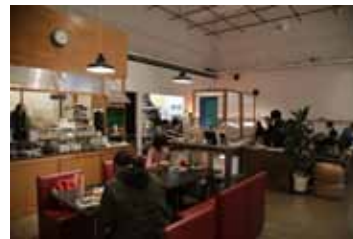
「高校生ウィーク 2018」カフェ風景、2018

2004年から毎年春に行ってきた「高校生ウィーク」の無料カフェ。「アートセンターをひらく 第Ⅰ期」ではスタッフの対象を多世代に広げ、高校生からシニアまでのボランティア・スタッフが運営にあたりました。第Ⅰ期で好評だった「ひらくカフェ」を、第Ⅱ期ではワークショップ室に場所を移して、ひきつづき多世代・多目的の場としてひらきます。カフェにはアーティスト関連書籍や推薦図書、裁縫・工作のための道具を常備。お茶会や部活動などさまざまな活動を行う場にもなります。セルフサービスで利用できるコーヒーやお茶を飲みながら、思い思いにお過ごしください。カフェスタッフも随時募集。詳細は後日ホームページでご案内します。