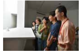
「session！」鑑賞風景、2018