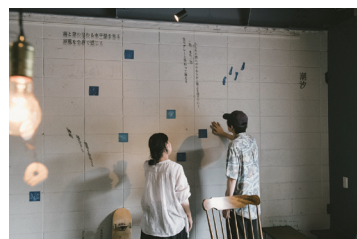
「或いは潮の満ち引きのように」2024年 展示風景

※クリテリウムは、ラテン語で「基準」を意味し、若手作家の新作を中心に紹介する企画展です。