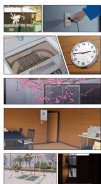
《3月》2015年 アニメーション、 シングルチャンネル・ビデオ (HD、カラー、サイレント) ループ

この2作品が制作された2015年、佐藤は翌年に控えた原美術館での個展「ハロドキュメンツ 10 佐藤雅晴—東京尾行」において発表する、新作《東京尾行》の制作に取り組んでいた最中の夏に上顎癌が再発し、緊急手術を受けました。