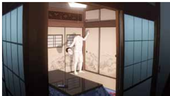
《SM》2015年 アニメーション、シングルチャンネル・ビデオ (HD、カラー、サウンド) ループ