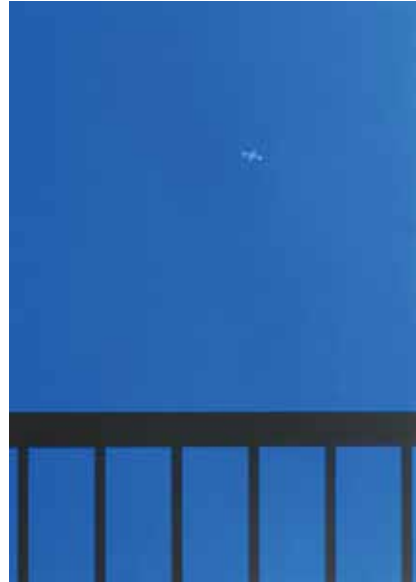
「死神先生」シリーズより《夜空》2018 年 アクリル絵具、木製パネル