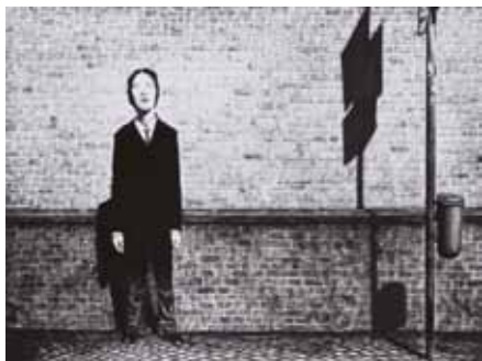
《I touch Dream #1》1999年 アニメーション、シングルチャンネル・ビデオ (SD、白黒、サイレント) 3分34秒

本展では、現存する佐藤の全映像作品を一堂に展示します。1999年にドイツに渡り、初めて制作した《I touch Dream #1》(1999年)から、未完となった最後の映像作品《福島尾行》(2018年)まで、全26作品が60以上のスクリーンとモニターで展示される、過去最大規模の回顧展となります。