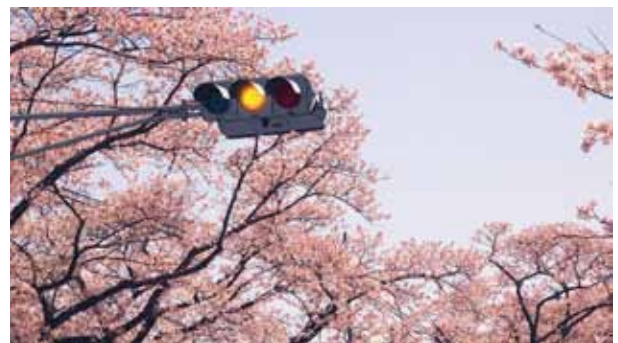
《福島尾行》2018年 アニメーション、シングルチャンネル・ビデオ (HD、カラー)、 自動演奏ピアノ ループ