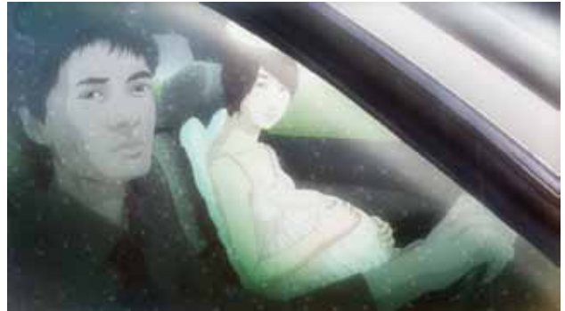
《バインド・ドライブ》2010-2011年 アニメーション、シングルチャンネル・ビデオ (HD、カラー、サウンド) 4分50秒