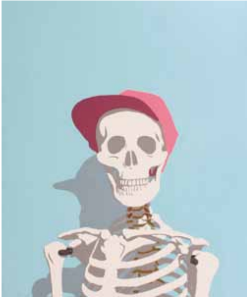
「死神先生」シリーズより《ガイコツ》2018 年 アクリル絵具、木製パネル