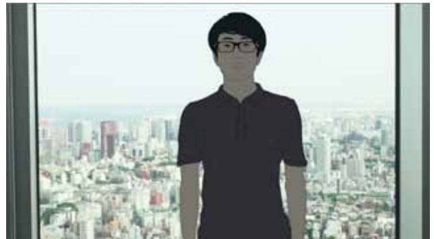
《東京尾行》2015-2016年 アニメーション、12チャンネル・ビデオ (HD、カラー)、自動演奏ピアノ ループ