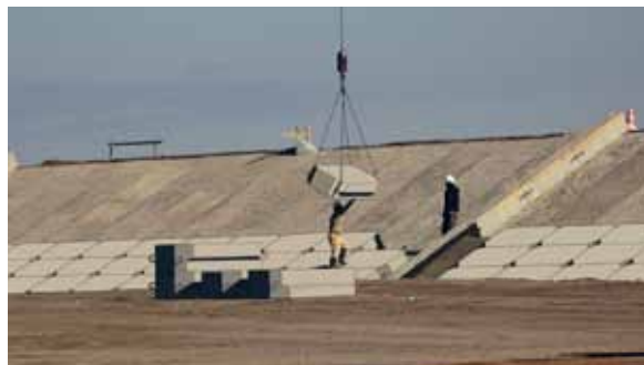
《福島尾行》2018年 アニメーション、シングルチャンネル・ビデオ (HD、カラー)、 自動演奏ピアノ、ループ