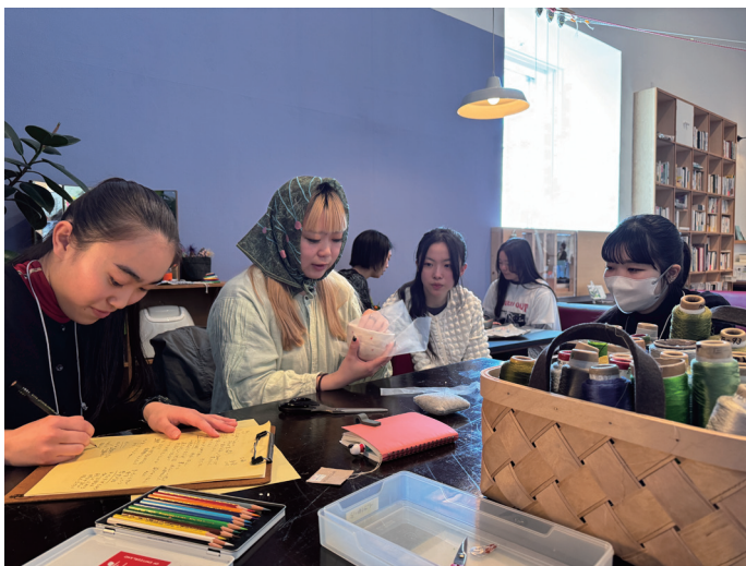
水戸芸術館「高校生ウィーク2026」でのプレ・ワークショップの様子