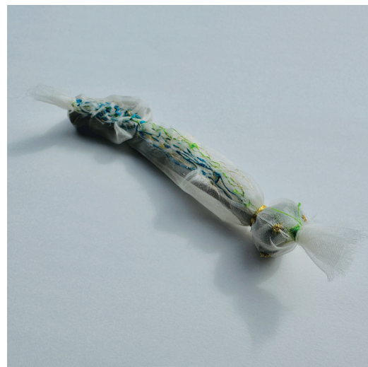
水戸芸術館「高校生ウィーク2026」でのプレ・ワークショップ参加者が修復した水戸芸術館広場のスプリングラ