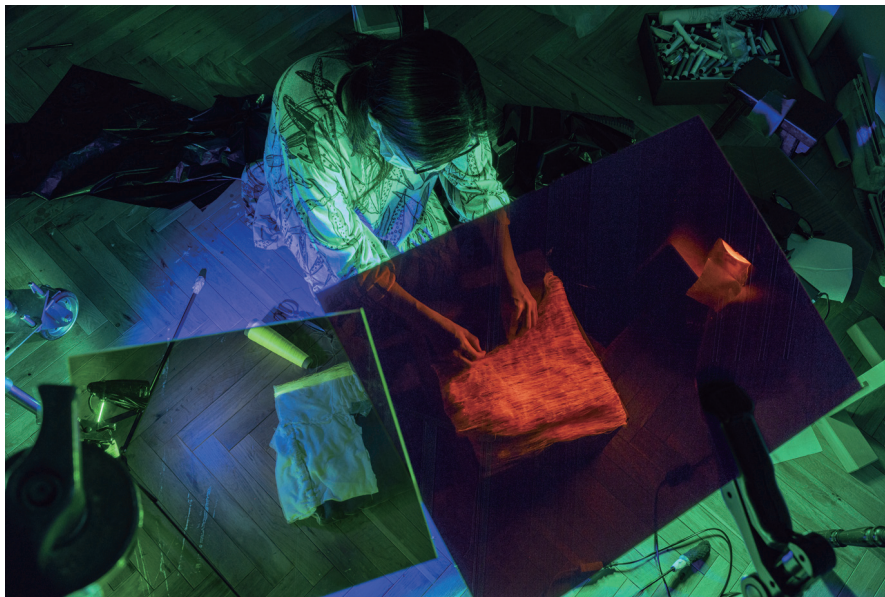
参考図版

(協力：国立研究開発法人農業・食品産業技術総合研究機構、群馬県立群馬県産業技術センター、株式会社 CACL)